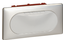
0685 00 Titan

akcesoria do połączeń między źródłami i ekranem, switche