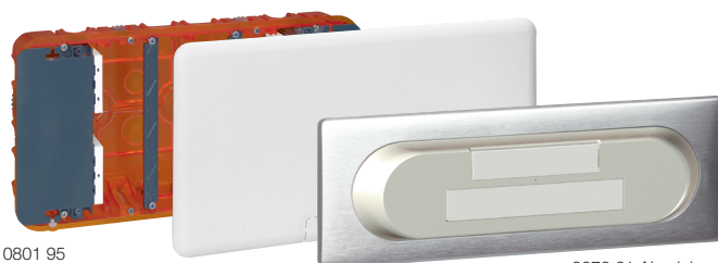
0673 61 Aluminium